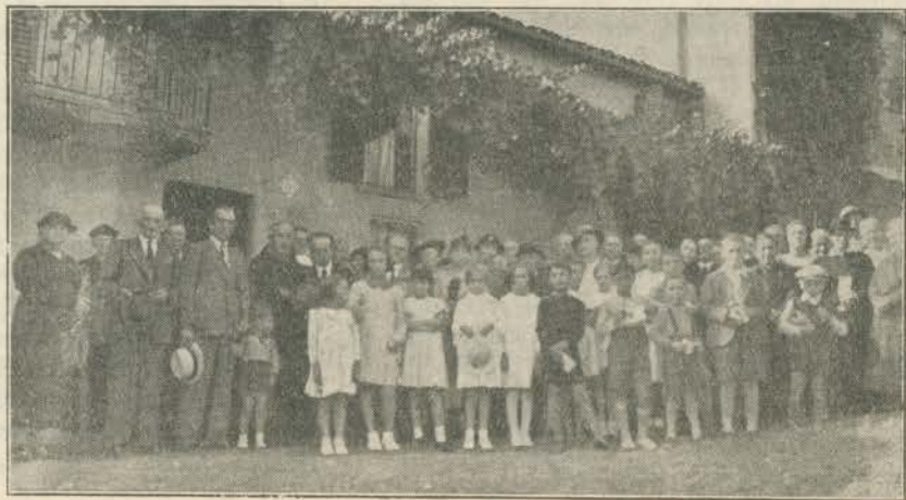
Il raduno davanti la casetta di Fra Leopoldo.

Ecco, è proprio solo di qui che poteva uscire D. Bosco e anche il caro Fra Leopoldo.