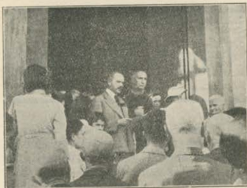
La commemorazione dinanzi a S. Grato.

do è proprio figlio della sua simpaticissima terra.