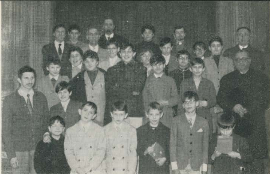
ragazzi delle Sezioni giovanili torinesi

Difatti al termine del ritiro nella chiesa di S. Croce durante la S. Messa e precisamente all'offertorio un ragazzo del gruppo della Sacra Famiglia ha fatto la consecrazione come Amico di Gesù Crocifisso e dopo di lui sei ragazzi l'hanno fatta come Aspiranti Catechisti.