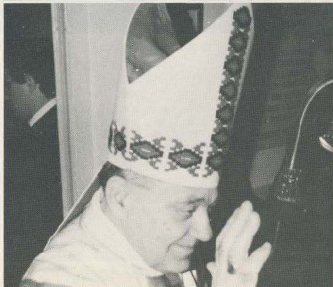
Il Cardinale Ballestrero alla Messa del Povero il 25 dicembre 1982