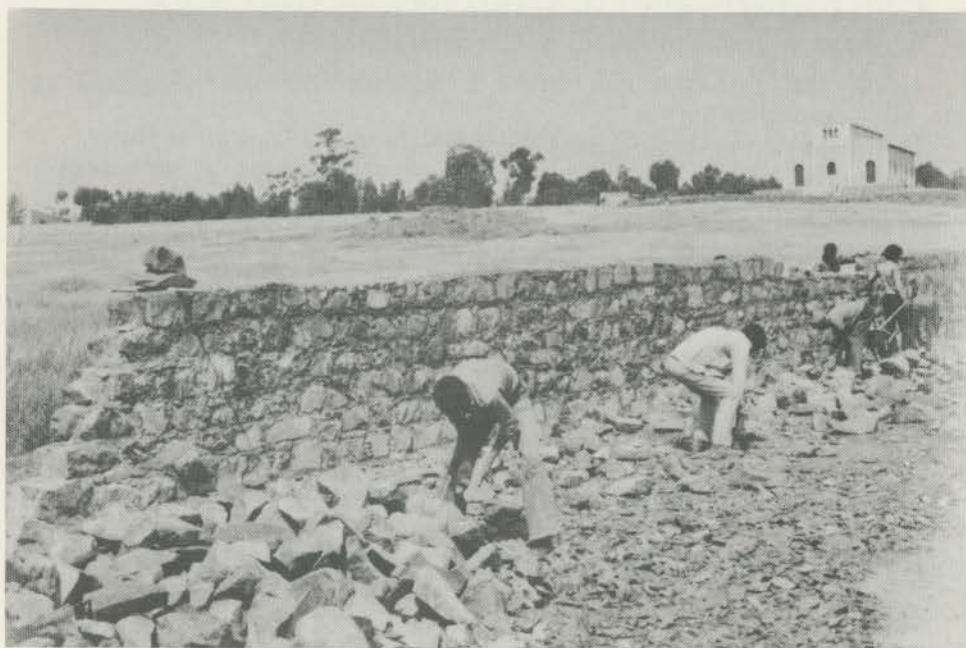
Costruzione muro di recinzione del "Centro di Carità"