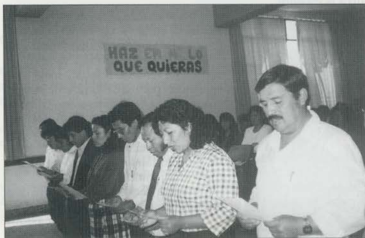
Consacrazioni di catechisti coniugati ad Arequipa.