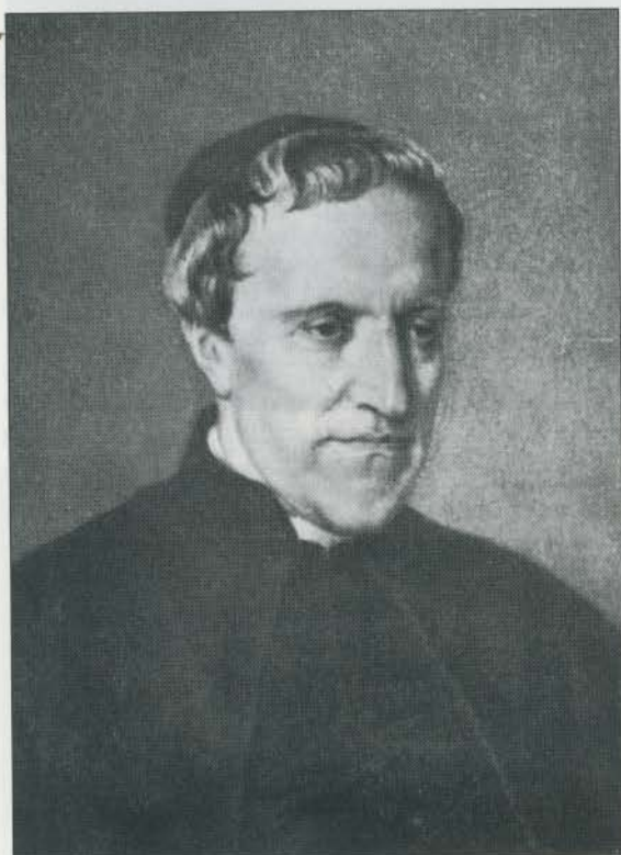
Antonio Rosmini Serbati (ritratto di Francesco Hayez).

In occasione dell'inizio della Causa di beatificazione di Antonio Rosmini, la Casa di Carità ha inviato all'Istituto della Carità, la Congregazione fondata dal Servo di Dio, la lettera qui riportata. A tale lettera segue lo scritto di don Remo Bessero, Direttore di Charitas, il bollettino rosminiano, sulle tematiche sollevate nella suddetta lettera, cioè l'attenzione serbata da Rosmini per la formazione professionale e per le attività lavorative in generale.