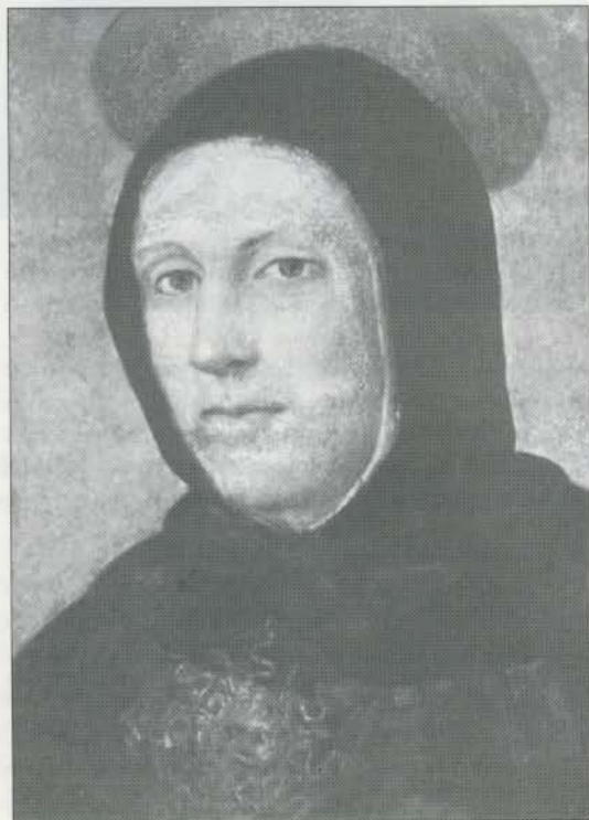
S. Tommaso d'Aquino (dipinto di fra Bartolomeo).

Il tempo pasquale ci richiama con particolare intensità sul mistero salvifico della morte e della resurrezione di Gesù. Per consolidare la nostra fede, alimentare la speranza e intensificare l'ardore della carità con solide argomentazioni, risaliamo direttamente alle fonti del pensiero teologico, riportando dei testi di S. Tommaso d'Aquino tratti da "La Somma Teologica".