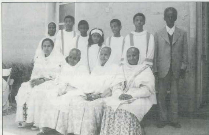
Asmara (Eritrea). Un gruppo di zelatrici con cresimati.