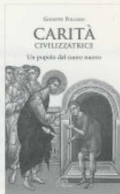
Immagine copertina del libro

to riveste un carattere prezioso, e per chi intenda ulteriormente avvertirne la profondità, riportiamo in nota la successione degli argomenti, secondo un "indice ragionato" 2 .