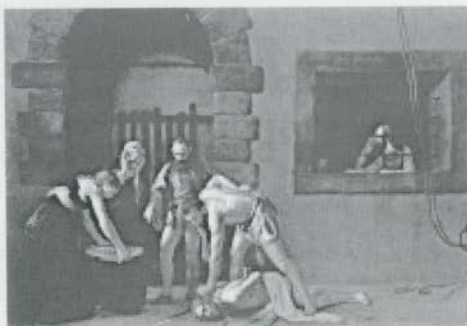
Caravaggio, "La decapitazione di San Giovanni Battista" - Malta

Il mio atto di amore per Torino, che oggi rinnovo con grande sincerità, è l'impegno personale che metto ogni giorno per portare con la mia preghiera e la mia azione pastorale quel supplemento d'anima senza la quale non arriveremo mai a vivere nella giustizia e nella pace. Buona festa a tutti!