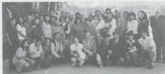
La Presidenza dell'Unione con un gruppo di catechisti di Arequipa

Affidiamo all'intercessione di fra Leopoldo e di fr. Teodoro, sotto la protezione dell'Immacolata, il sostegno spirituale al rieletto presidente per un proficuo espletamento di tale delicata missione, formulandogli gli auguri più sinceri, e ringraziandolo per la sua generosa disponibilità.