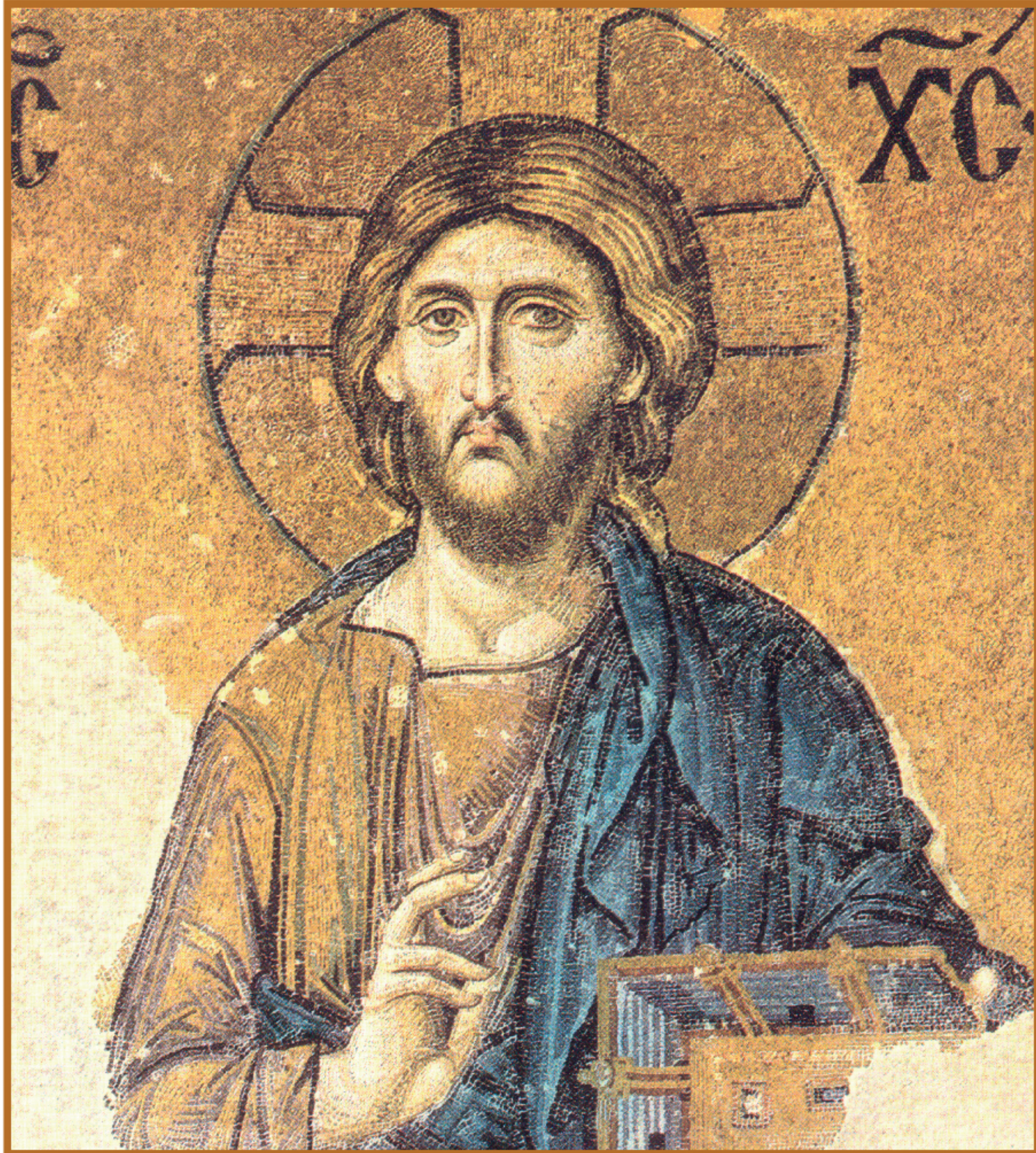
Pantocratore, particolare del mosaico della Basilica di Santa Sofia, Istanbul

SETTIMANA DI PREGHIERA PER L'UNITÀ DEI CRISTIANI 18-25 gennaio 2019