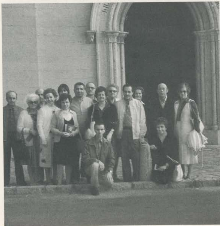
Assisi 10-9-1982 Gruppo Familiare Unione Catechisti davanti Rivortorto