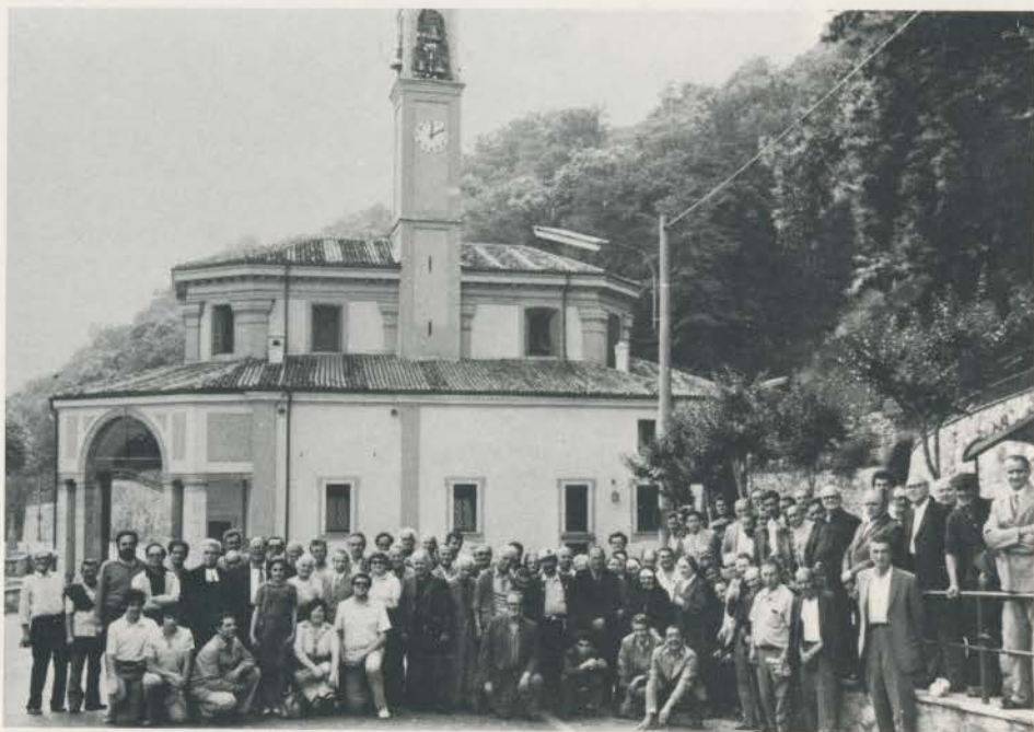
Gita - pellegrinaggio al Santuario di Ns. Signora del Bosco (Imbersago - Va)