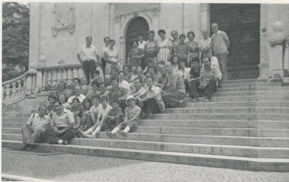
Gita pellegrinaggio al Sacro Monte di Varallo