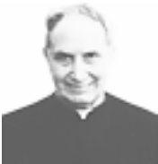
Figura insigne del clero torinese, a tutti noto per il suo zelo apostolico e la fecondissima attività che ha contrassegnato la sua missione sacerdotale.

È stato il fondatore della Città dei Ragazzi, nell'immediato dopoguerra, per prestare assistenza e formazione alle giovani vittime di quegli anni difficili, favorendone l'educazione anche con il metodo dell'autogestione.