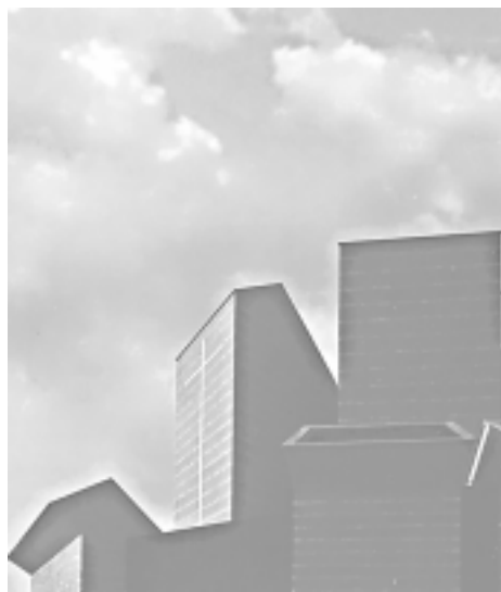
Veduta parziale dal basso