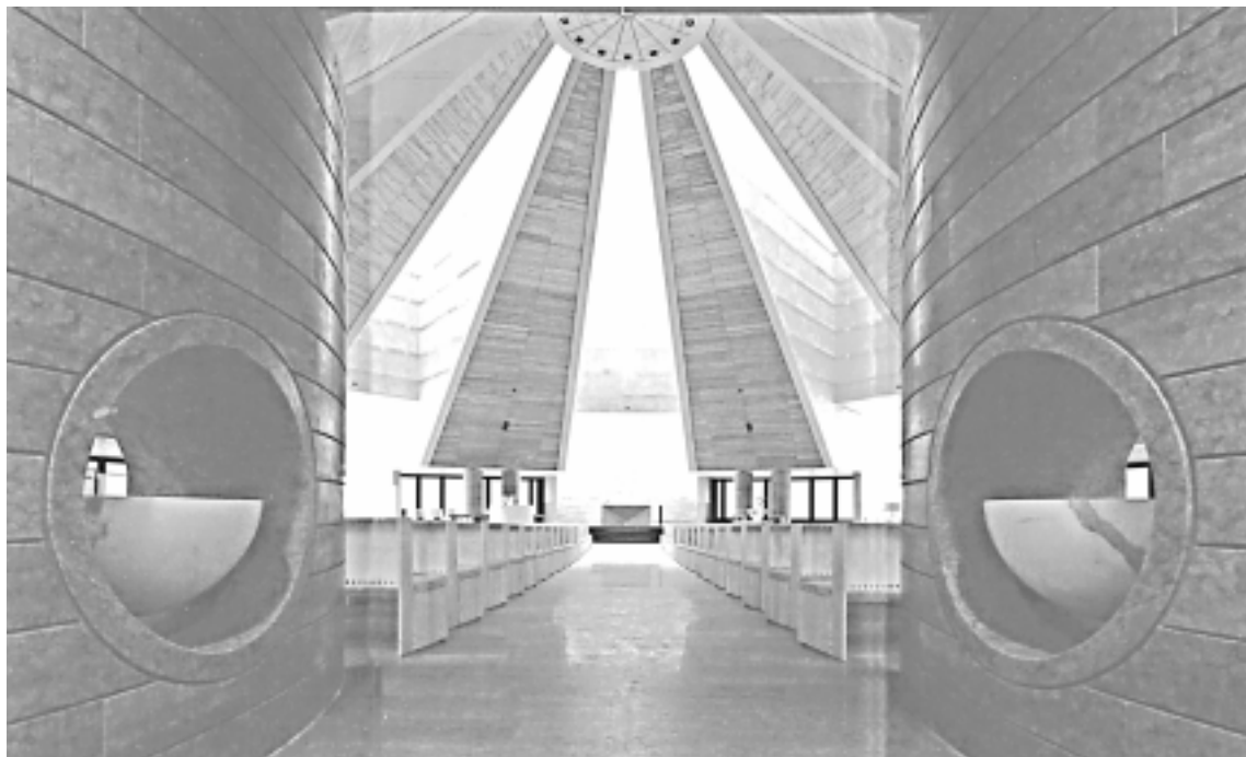
Vista interna della chiesa