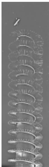
Torretta della chiesa