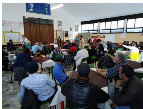
Gli ospiti durante una festa

Gli incontri ricreativi e le festicciole particolari, come è stato già osservato nelle varie relazioni su questa particolare attività caritativa, hanno appunto lo scopo di agevolare la socialità e il senso comunitario, ma altresì di apportare conforto e sollievo a quanti sono sovente in situazione di disagio, di solitudine e di sofferenza. Il festeggiare insieme è sempre occasione per fare sentire meno l'isolamento a questi nostri fratelli, e per dare un senso di famiglia anche a chi da molto non lo vive più: in tal modo si attenuano la nostalgia, patita da vari ospiti, di un po' di calore umano, e l'acuto e intimo desiderio di sentirsi parte di una società in cui la comprensione e la carità cristiana abbiano ancora un loro significato. L'incontro giocoso, con semplici lotteria, e analoghe gare emulative, premiate con modesti ma apprezzati regalini, stimolano l'attenzione dei partecipanti, anche perché non più abituati a riceverne.