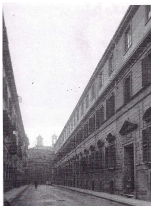
L'esterno delle prime due aule in via delle Rosine

Nel primo anno gli allievi della scuola diurna, ripartiti nelle due classi, arrivarono a 60, e quelli della scuola serale a 70, pure in due classi.