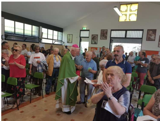
Un incontro con l'Arcivescovo mons. Nosiglia